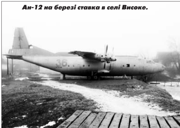
Ан-12 на березі ставка в селі Високе.

ний полк. Військове містечко вмерло. Не до пам'ятника.